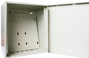
LINCE 11 Gabinete compatible