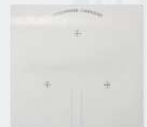
Guía de corte