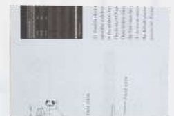
Manual de usuario