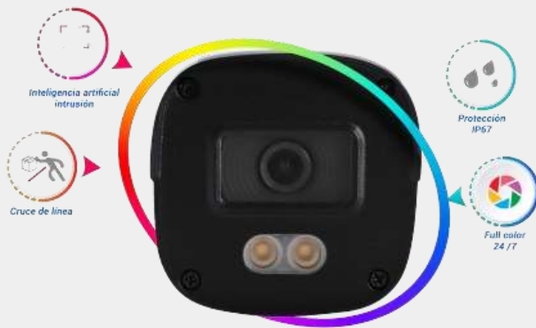
Cámara IP Bullet MOB-200FC1L